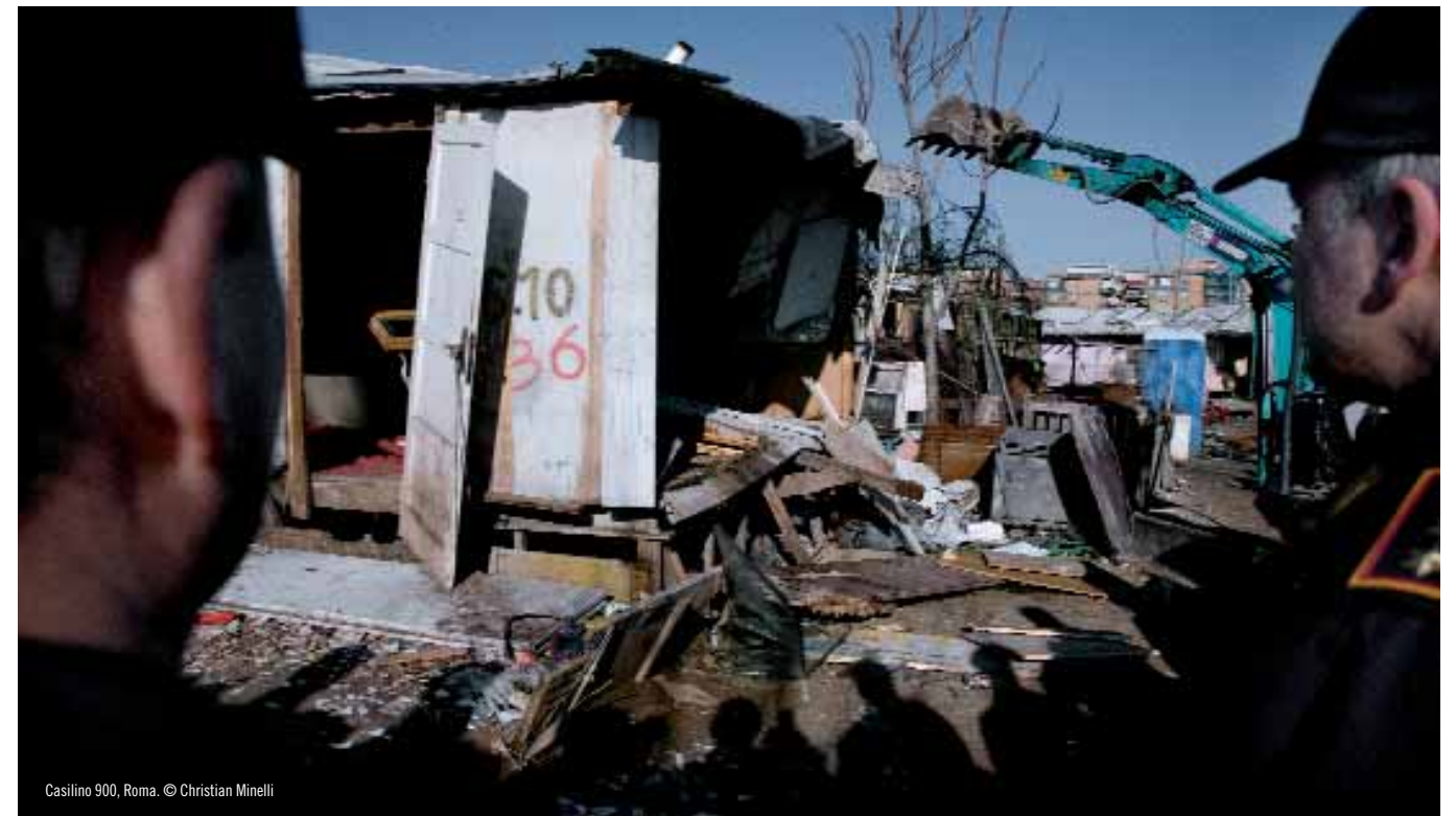
Casilino 900, Roma.

Le sue pubblicazioni affrontano la storia della persecuzione dei rom durante il nazi-fascismo e la permanenza dello stereotipo dello "zingaro" a livello socio-educativo. Il suo ultimo libro è "Tra inclusione ed esclusione - Una storia sociale dell'educazione dei rom e dei sinti in Italia" (Edizioni Unicopli).