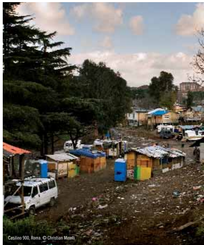
Casilino 900, Roma.

Nel 1899, Alfred Dillmann, commissario di polizia di