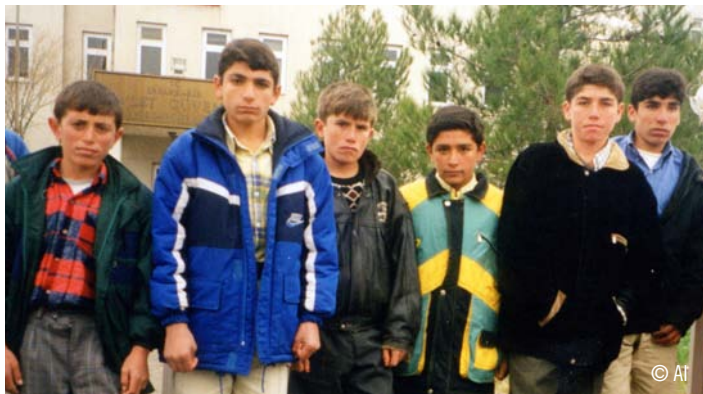
Alcuni ragazzi curdi processati in Turchia.

In Turchia, nelle province di Diyarbakir e di Adana, ci sono state molte proteste da parte della comunità curda per chiedere il rispetto dei propri diritti al governo turco. A queste manifestazioni hanno preso parte anche molte famiglie con bambini.