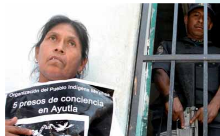
Messico, 5 febbraio 2009. un'esponente dell'Organizzazione del popolo nativo me'phaa manifesta all'esterno della prigione di Ayutla, chiedendo il rilascio immediato di cinque prigionieri di coscienza, arrestati il 17 aprile 2008 con l'accusa di omicidio.