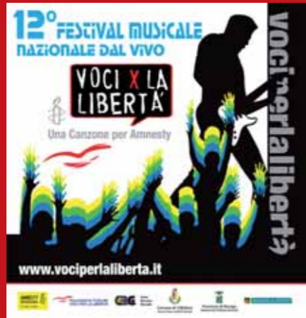
La copertina della nuova compilation "Voci per la Libertà". Per acquistarla on line vai su: www.cinicodisincanto.it/shop/shop.htm

L'anno scolastico si è concluso con la premiazione delle classi Amnesty Kids! che hanno vinto la seconda edizione del concorso "Adotta un diritto", dedicato al 20° anniversario della Convenzione sui diritti dell'infanzia e dell'adolescenza. Per conoscere tutti i nomi delle classi premiate, visita la pagina www.amnesty.it/adottaundiritto .