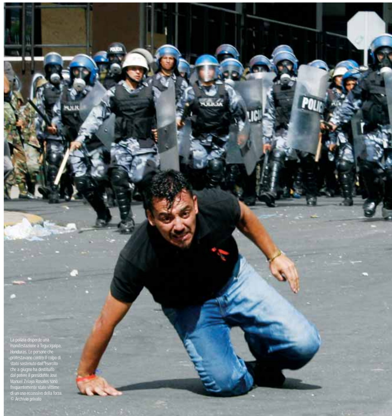
La polizia disperde una manifestazione a Tegucigalpa, Honduras. Le persone che protestavano contro il colpo di stato sostenuto dall'esercito che a giugno ha destituito dal potere il presidente José Manuel Zelaya Rosales sono frequentemente state vittime di un uso eccessivo della forza.

In molti casi non si tratta di una giustizia pienamente soddisfacente: hanno pesato, tra l'altro, il segreto di stato imposto dal governo italiano per il caso Abu Omar e la mancanza del reato di tortura per Bolzaneto. Le decisioni citate rappresentano, tuttavia, passi importanti nel cammino verso la verità, che non è terminato e che