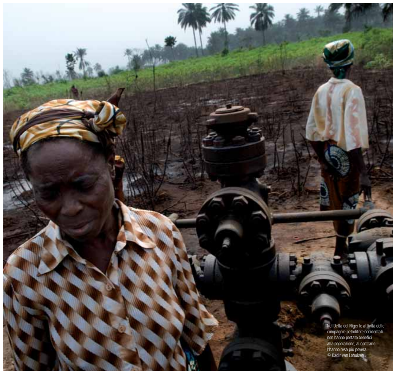
Nel Delta del Niger le attività delle compagnie petrolifere occidentali non hanno portato benefici alla popolazione, al contrario l'hanno resa più povera.

Sotto accusa, anche per il suo effetto sui gas serra che riscaldano l'atmosfera del pianeta, è la pratica del gas flaring, cioè l'uso di bruciare i gas che si trovano nello strato più alto del giacimento di petrolio. Migliaia di fuochi alimentati da una fortissima pressione interna surriscaldano l'atmosfera già torrida del Delta, inquinando l'aria. La legge vieta questa pra-