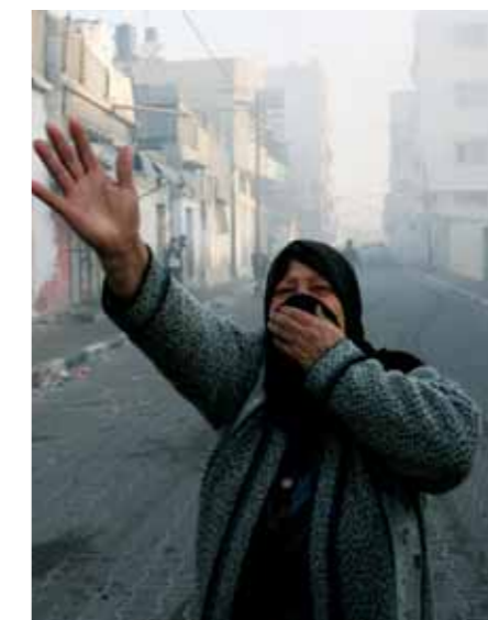
Una donna palestinese si copre la faccia per ripararsi dal fumo di un'esplosione durante un attacco aereo israeliano sulla città di Gaza, 14 gennaio 2009.

Il Rapporto annuale 2010 è acquistabile on line sul sito www.fandango.it oppure può essere ordinato ad Amnesty International a fronte di un versamento di un'offerta minima di € 32,00, spese postali incluse (per richiedere più copie contattare gli uffici al numero 0644901). La richiesta dovrà essere inviata a: Amnesty International, Settore Pubblicazioni, via G.B. De Rossi 10, 00161 Roma (fax 06 4490222), allegando la ricevuta di un versamento sul ccp 70691001 intestato ad Amnesty International, via G.B. De Rossi 10, 00161 Roma, specificando sulla causale "RA10".