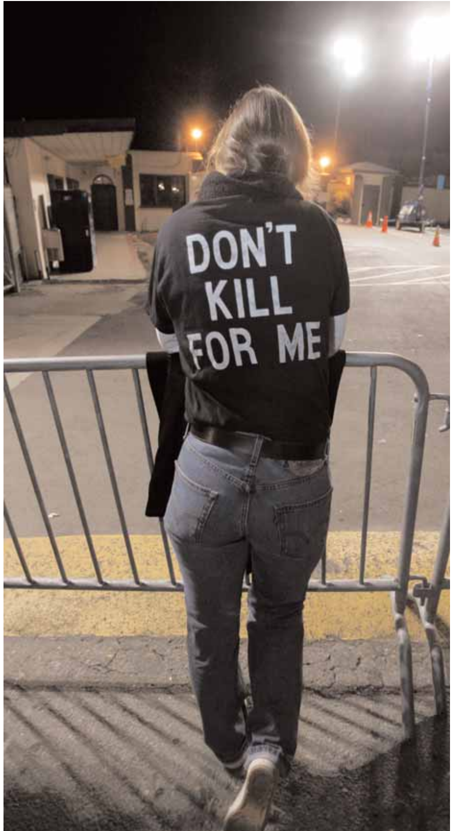
Una manifestante contro la pena di morte protesta contro l'esecuzione in California, USA, di Clarence Ray Allen, 76 anni, non vedente costretto alla sedia a rotelle. Clarence Ray Allen è stato messo a morte con un'iniezione letale il 17 gennaio 2006, dopo aver trascorso 23 anni nel braccio della morte.

I parenti di coloro che sono stati uccisi hanno tutto il diritto di vedere giudicati i colpevoli dei reati attraverso un processo equo, ma consentire loro di influenzare l'iter giudiziario rischia di eliminare uno dei caratteri principali della moderna giurisprudenza in base al quale tutti sono uguali dinanzi alla legge.