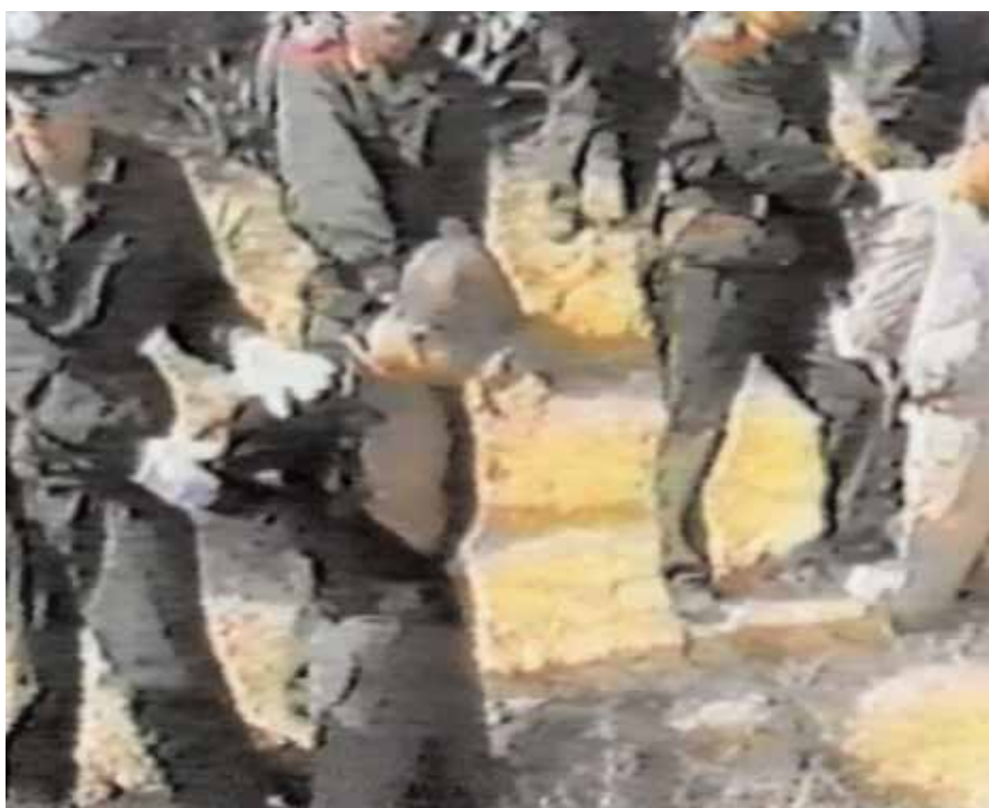
Tratto da un video, questo fotogramma ritrarrebbe la preparazione dei prigionieri durante un'esecuzione pubblica avvenuta nella provincia di Fukien, Cina, nel 1992.

La logica, inoltre, dovrebbe dettare che tale segreto riduce qualsiasi presunto effetto deterrente che le esecuzioni dovrebbero avere. Anche a Singapore la situazione è simile. Il paese approva la pena di morte, ma tace su quanto sia utilizzata. La libertà di espressione è limitata da controlli imposti dal governo su stampa e organizzazioni della società civile, rendendo così impossibile il monitoraggio indipendente dei diritti umani, inclusa la pena di morte.