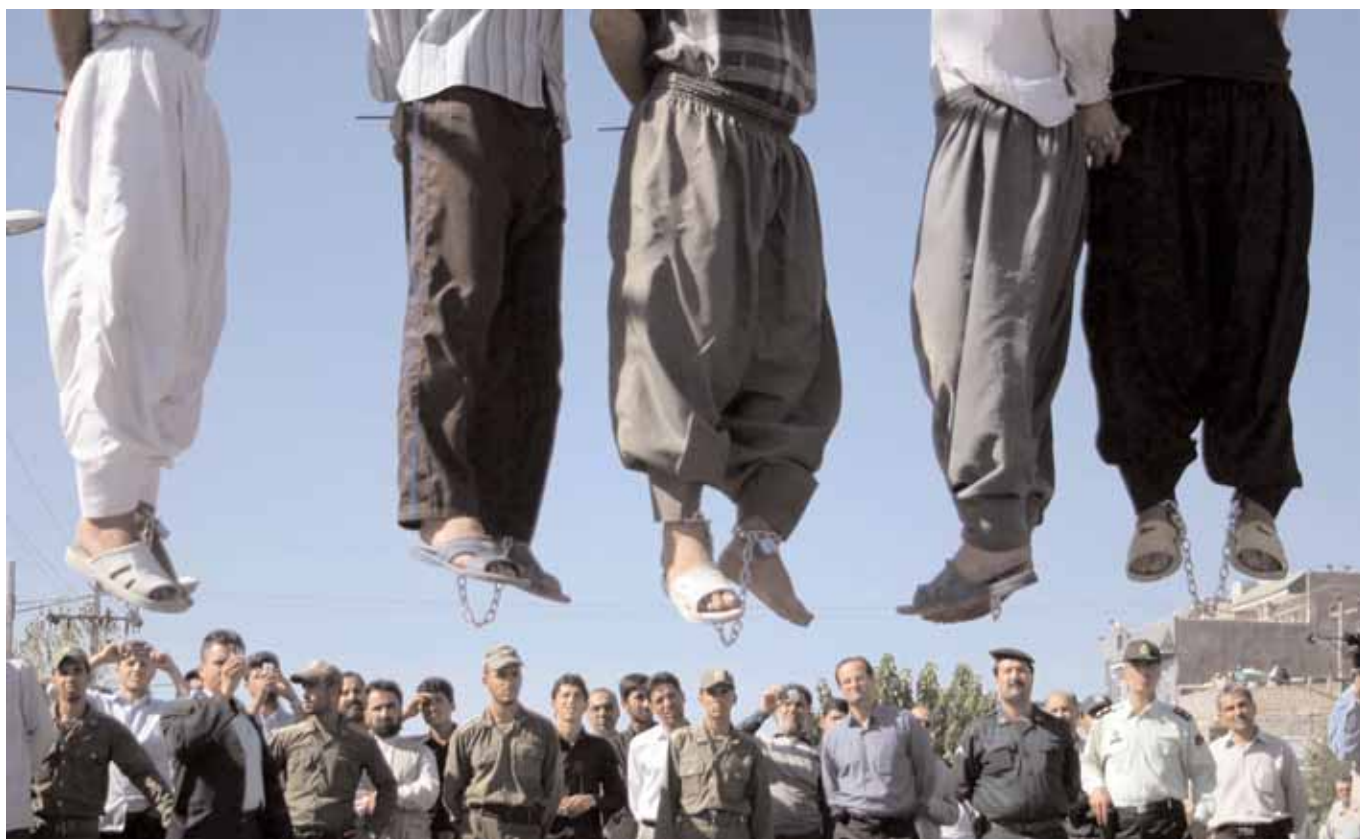
Cinque uomini impiccati in pubblico a Mashhad, Iran, nell'agosto 2007.

La pena di morte è la punizione più crudele, inumana e degradante. Viola il diritto alla vita.