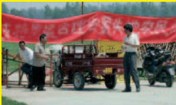
Manifestanti alla periferia di Pechino, dove è stata costruita la struttura dove si svolgeranno le discipline acquatiche. Lo striscione reca il testo: «Sosteniamo le Olimpiadi. Compensate adeguatamente i contadini che hanno perso le loro terre».

Esprimate tale auspicio anche trascrivendolo sulle bandiere della campagna dei Gruppi locali di Amnesty International (contatta il Gruppo locale più vicino consultando la sezione «cosa puoi fare tu» del sito web www.amnesty.it ).