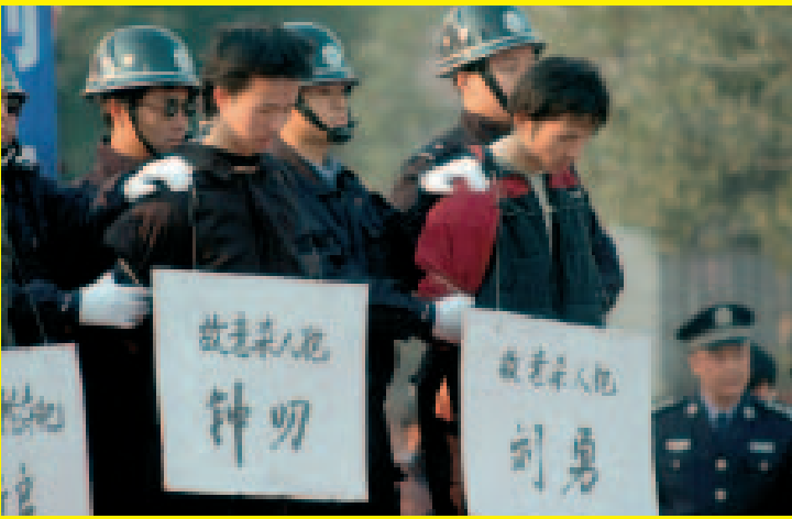
Detenuti condannati a morte durante un processo pubblico, Zhuzhou, provincia dello Hunan, Cina centrale. Si può leggere in cinese, sotto ai nomi dei detenuti «Assassino».

Sulla base di notizie provenienti dai mezzi di informazione, Amnesty International stima che nel 2007 siano state eseguite almeno 470 condanne a morte e ne siano state emesse almeno 1860. E' impossibile stabilire se questo dato, apparentemente inferiore a quello dell'anno precedente, dipenda da una reale diminuzione rispetto al 2006 oppure da un cambiamento nel modo di riportare le notizie o da altri fattori perché il governo non fornisce statistiche ufficiali sulla pena di morte. Amnesty International stima che nel 2006 ci siano state almeno 1010 esecuzioni e 2790 condanne. Un gruppo di universitari cinesi, basandosi su fonti ottenute da persone che hanno accesso ai dati ufficiali, stima che il numero effettivo delle esecuzioni nel 2006 sia tra 7500 e 8000. In Cina la pena di morte è prevista per 68 reati inclusi atti non violenti quali la frode fiscale, la distruzione di fondi, la corruzione e alcuni reati legati alla droga.