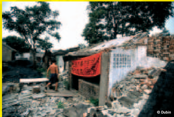
Una casa semi-distrutta a Pechino. Sul manifesto è scritto: «Agite secondo la legge. Sfratto o no, è qui che vivo.»