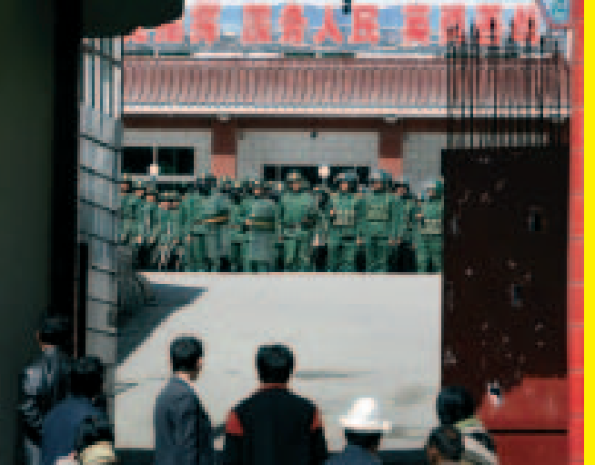
Poliziotti schierati in assetto antisommossa nella caserma di Xiahe nella provincia di Gansu il 16 marzo 2008.

La chiusura del Tibet e delle regioni limitrofe a tutti i mezzi di informazione rende difficile confermare le informazioni provenienti da queste zone e va contro la promessa ufficiale che era stata fatta dalle autorità cinesi di dare ai mezzi di informazione «completa libertà» in vista delle Olimpiadi.