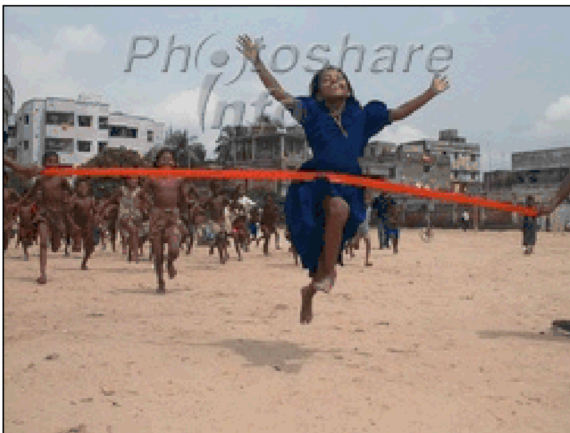
Un giovane ragazza salta attraverso il nastro vincendo una gara della sua scuola a Dhaka, in Bangladesh