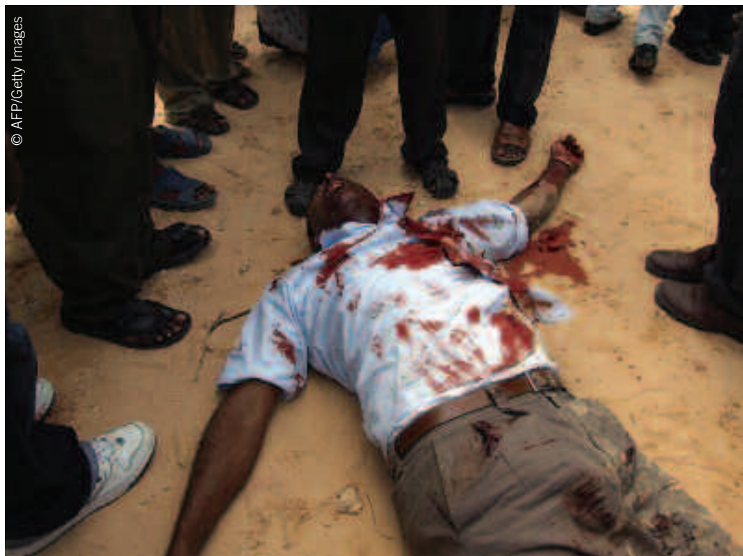
Il corpo del giornalista somalo Ali Imam Sharmake, direttore del gruppo editoriale HornAfrik, ucciso da un'autobomba l'11 agosto 2007 a Mogadiscio.

L'Nsa è stata più volte identificata dai giornalisti somali come responsabile degli attacchi e degli arresti nei confronti dei giornalisti. Uomini dell'Nsa hanno fatto irruzione nelle abitazioni dei giornalisti e hanno chiuso organi d'informazione che avevano pubblicato materiale giudicato contrario agli interessi del Tfg.