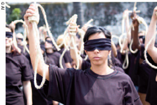
61 attivisti in Messico protestano rappresentando i 71 bambini e ragazzi che si trovano nel braccio della morte iraniano in attesa dell'esecuzione

È impossibile determinare quante persone innocenti sono state, o stanno per essere messe a morte. Dopo l'esecuzione, raramente avviene una revisione del processo o vengono avviate indagini