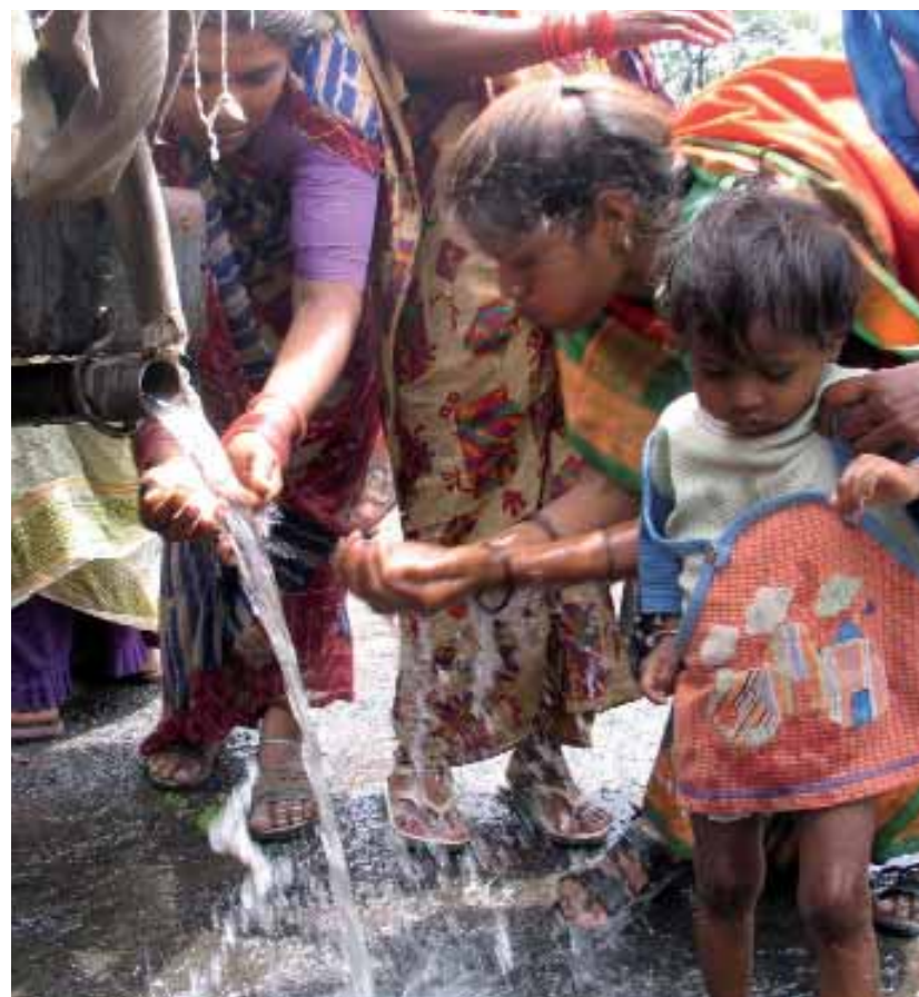
Bhopal, 20 luglio 2004: donne e bambini bevono dal camion del governo che fornisce acqua potabile durante una manifestazione di protesta proprio per la mancanza di fornitura di acqua pulita.