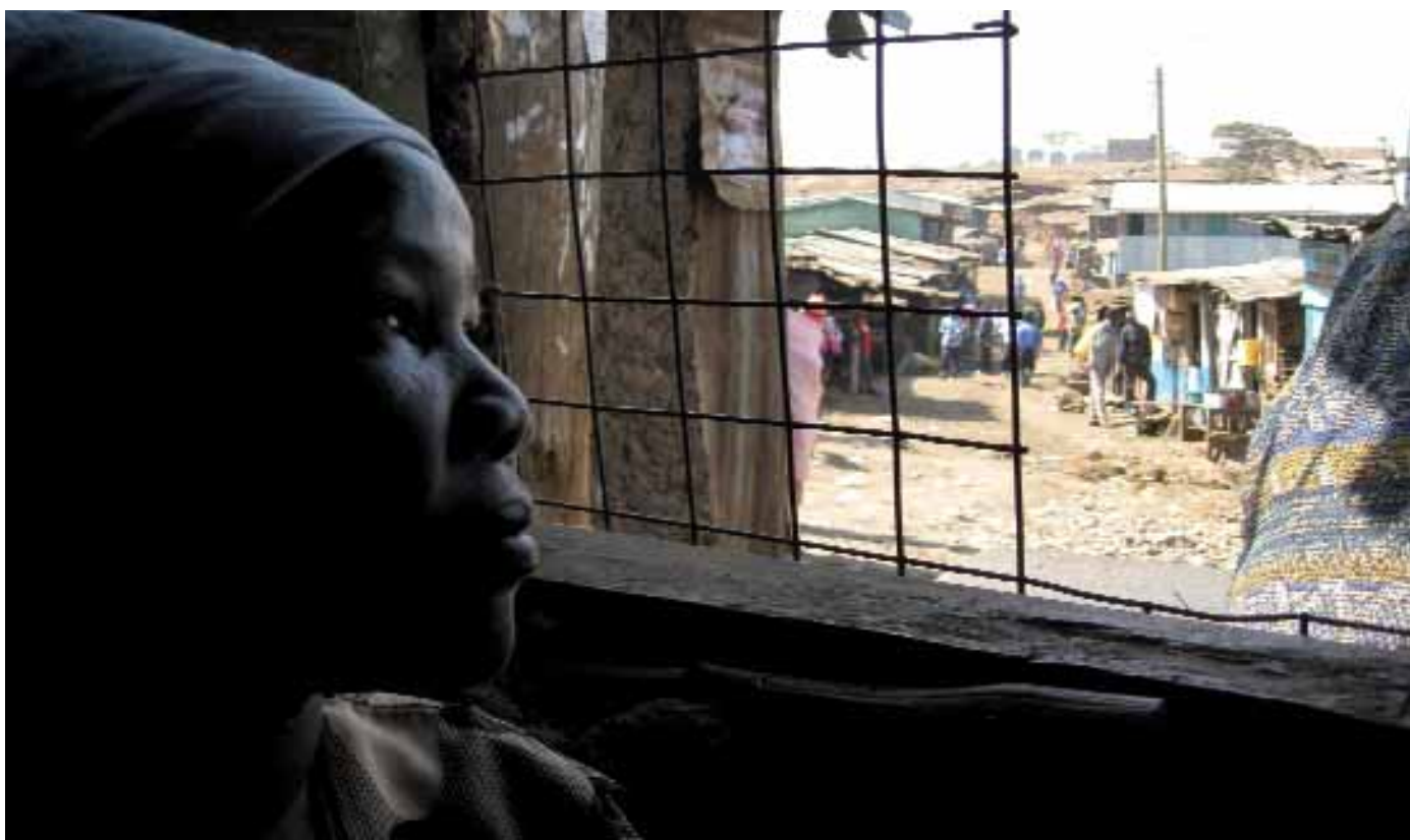
Una donna guarda fuori dalla finestra a Soweto, uno dei molti villaggi di Kibera, il più grande insediamento informale del Kenya, 9 marzo 2009.