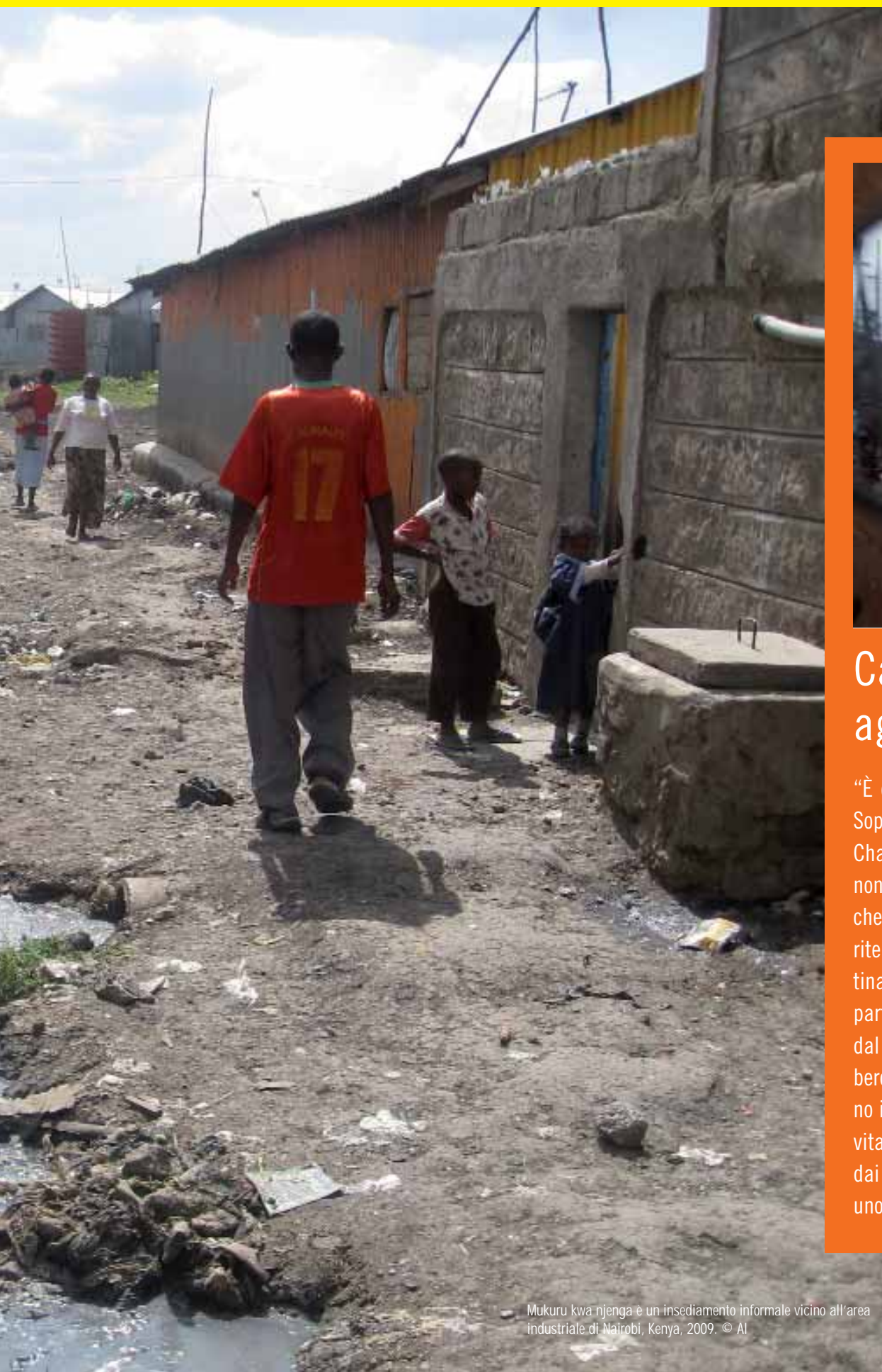
Mukuru kwa njenga è un insediamento informale vicino all'area industriale di Nairobi, Kenya, 2009.