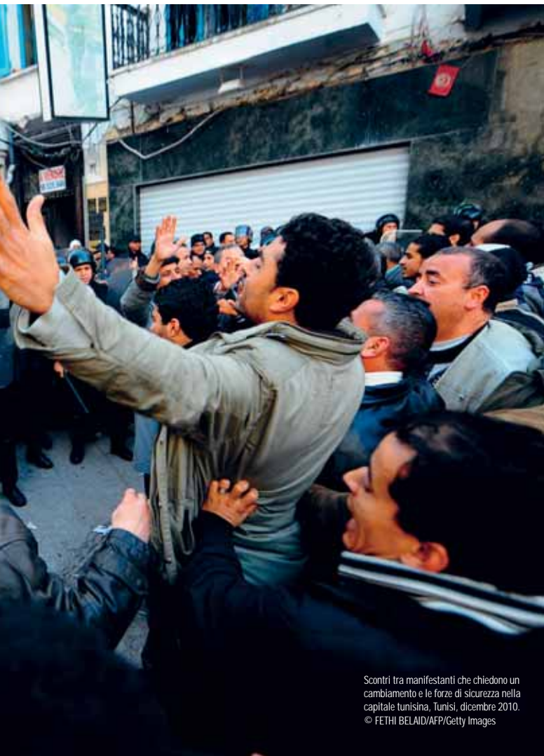
Scontri tra manifestanti che chiedono un cambiamento e le forze di sicurezza nella capitale tunisina, Tunisi, dicembre 2010.

mato il diritto di un marito a 'disciplinare' la moglie e i figli a patto di non lasciare segni, mostrando di fatto di tollerare la violenza domestica ... L'azione non deve superare i limiti previsti dalla legge islamica".