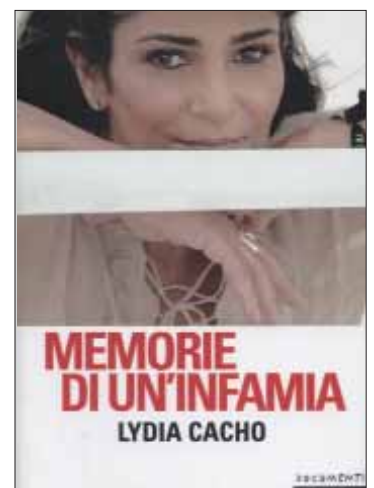
Memorie di un'infamia Lydia Cacho Fandango Libri, novembre 2011, € 16,50