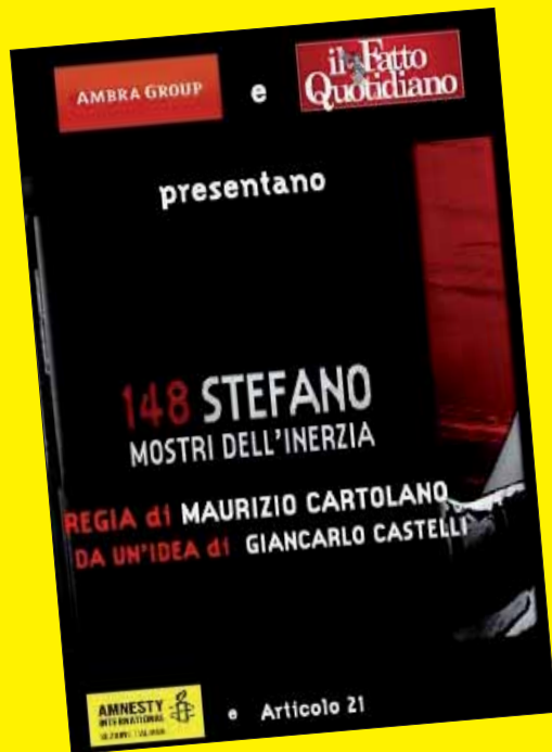
148 Stefano. I mostri dell'inerzia regia di Maurizio Cartolano da un'idea di Giancarlo Castelli prodotto da Ambra Group in collaborazione con Il Fatto quotidiano Italia, novembre 2011, € 9,90